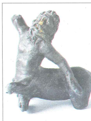
La statuette du centaure trouvée lors des fouilles à la Perdirotais, en 2008-2009

L'association Historique du pays de Châteaugiron a organisé, mardi 13 décembre au château, une rencontre sur le thème du centaure. Un thème devenu cher à la cité depuis la découverte d'une belle statuette romaine de centaure en